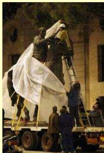
Retirada de la estatua de Franco

El Foro por la Memoria desarrolla la Campaña "Limpia tus calles de fascismo", exigiendo de las autoridades, de las fuerzas políticas y sociales, de los medios de comunicación, un pronunciamiento explícito, un compromiso inequívoco por la retirada de todos y cada uno de los símbolos del franquismo. Puedes adherirte a la campaña en: http://www.nodo50.org/foroporlamemoria/