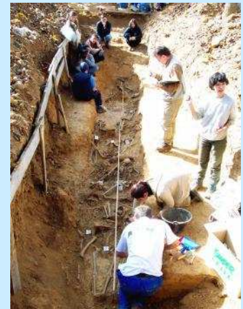
Priaranza del Bierzo

O bserva la siguiente imagen y explica cuál sería tu posición sobre si es necesario o no desenterrar a las víctimas de la represión durante la dictadura franquista. Argumenta razonadamente tu postura.