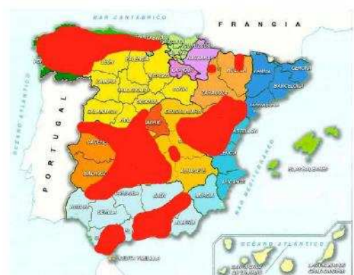
De 1936 a 1952 actuó el Maquis español de carácter rural en las zonas marcadas en rojo

rrilla propiamente dicha, que se extendería como mucho hasta finales de 1946. Un tercer periodo, de absoluta agonía del movimiento guerrillero, abarcaría hasta mediados de 1955, cuando abandonan la zona centro los últimos guerrilleros que, a pesar de que todavía conservaban parte de sus objetivos políticos iniciales, básicamente pretendían sobrevivir, esperando que se presentase el momento