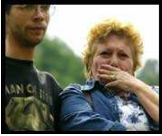
Una hija puede llorar a su padre 70 años después de su asesinato