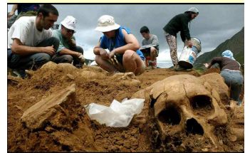
Excavación en el Bierzo (León)

pios políticos y éticos que hicieron nacer a la izquierda, a las luchas actuales.