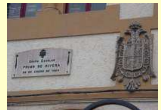
Plaza del Generalísimo Villaviciosa (Asturias)

¿C ómo es posible que 30 años después de la muerte del dictador sigan existiendo en todo el Estado español monumentos, símbolos, nombres de calles y plazas vinculados al régimen surgido del golpe de estado del 18 de Julio de 1936? ¿Cuántos monumentos se han erigido en Berlín a Adolfo Hitler? ¿Cuántas calles llevan en Roma el nombre de los jefes del fascismo?. Entonces ¿cómo es posible que, en centenares de poblaciones, se siga rindiendo homenaje a jefes de un régimen tiránico, a pistoleros fascistas expertos en "la dialéctica del puño y de las pistolas", a militares que traicionaron su juramento de lealtad al régi-