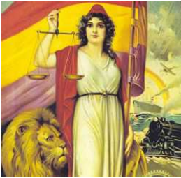
Imagen de la República