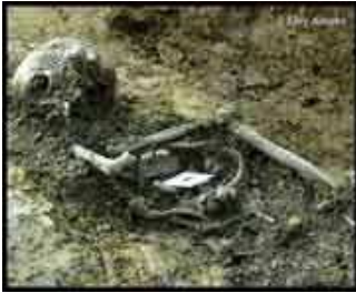
Fosa de Valdediós (Asturias)