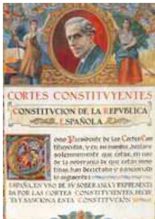
La Constitución Republicana

"Hay que sembrar el terror ...Hay que eliminar sin escrúpulos a todos los que no piensen como nosotros" (General Mola a los alcaldes navarros)