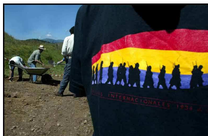
Fosa de Piedrafita de Babia (León)

"Me sobrecogería la tristeza al pensar en ellos, me acompañarían día y noche, y a cada paso a través de este mundo nuevo y alimentado de nuevo por el delirio, me preguntaría de dónde habían sacado la fuerza para su coraje y su resistencia, y la única explicación sería esa esperanza oscilante, pertinaz, denodada que es la que sigue dándose en todas las cárceles"