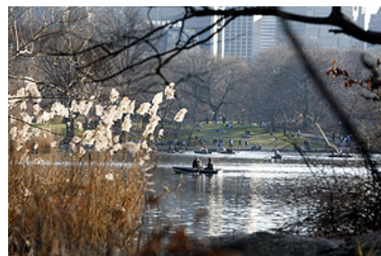
El clima inusualmente cálido permite disfrutar de Central Park (Nueva York).

Y es que las imágenes de la ciudad cercada por la nieve parecen ya de otro siglo. Las postales de Central Park cubierto con una "sábana blanca" forman parte de la mitología o del cine.